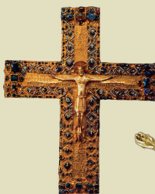
Gizella királyné keresztje