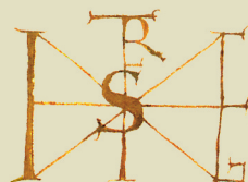
István király névjele (Stephanus Rex)