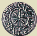
István által kibocsátott pénz