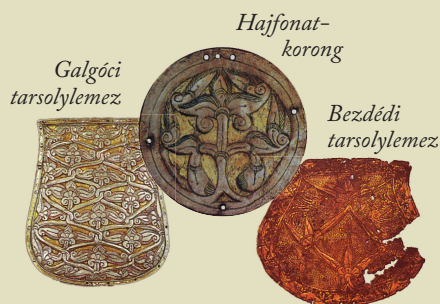
KALANDOZÁSOK • 899–970