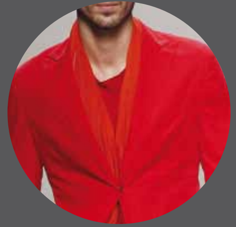
012 VICTORIO & LUCCHINO SPAIN