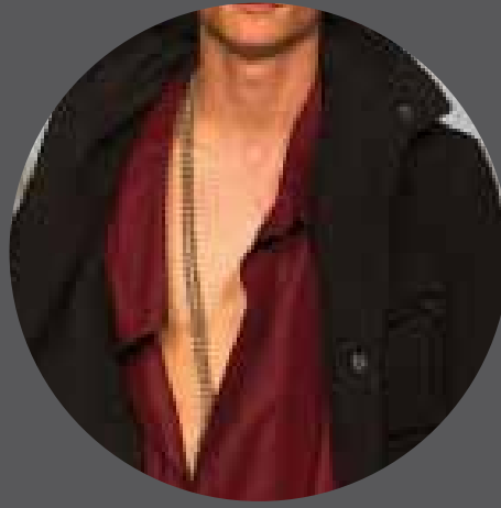
002 THE SWEDISH SCHOOL OF TEXTILES SWEDEN