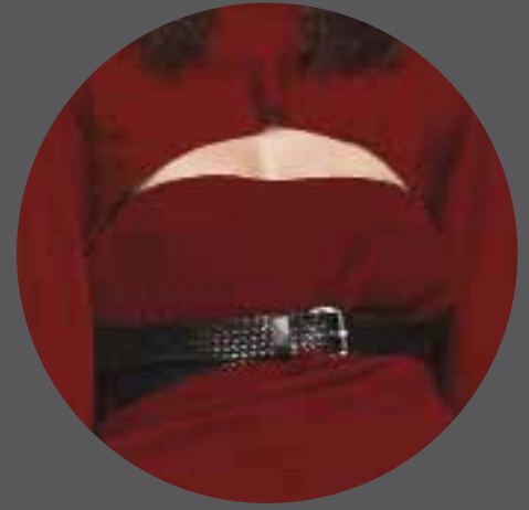
003 ANJARA SPAIN