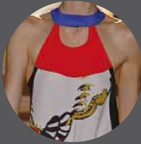
008 TSUMORI CHISATO JAPAN