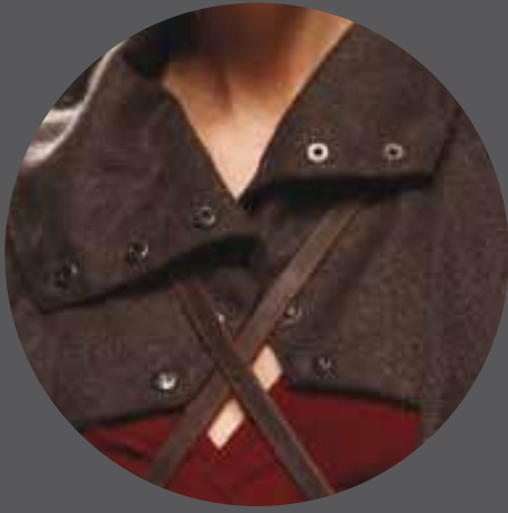
004 ANJARA SPAIN