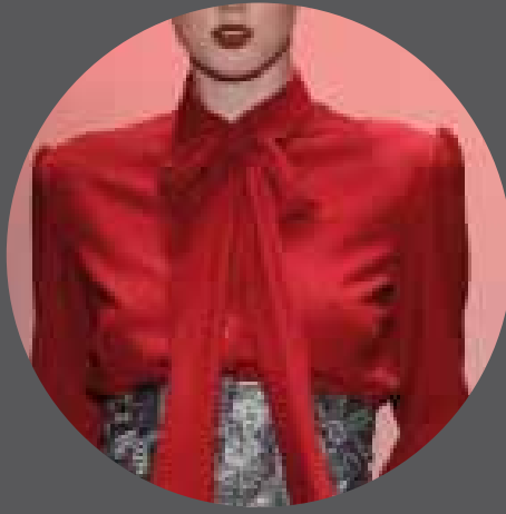
011 BORA AKSU TURKEY