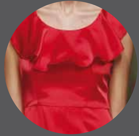
009 BEBA'S CLOSET SPAIN