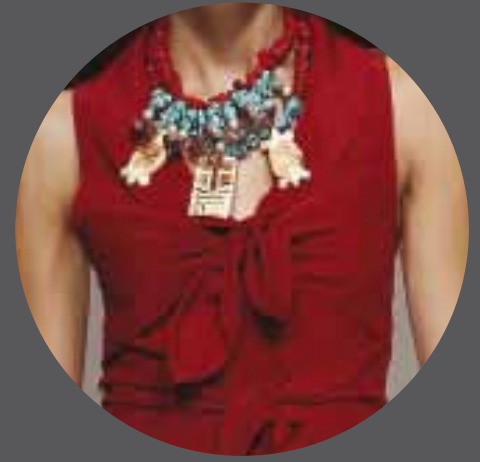
006 AMERICAN PÉREZ SPAIN