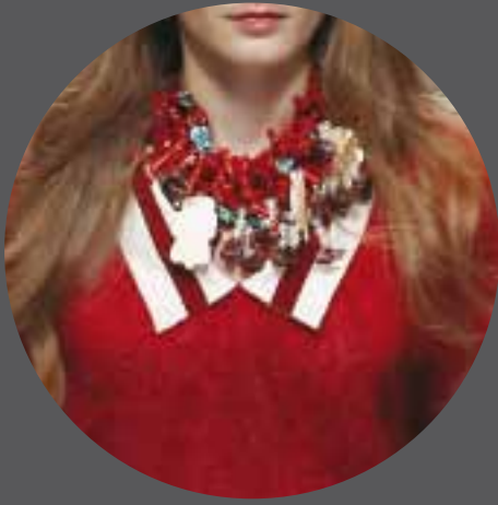
001 AMERICAN PÉREZ SPAIN